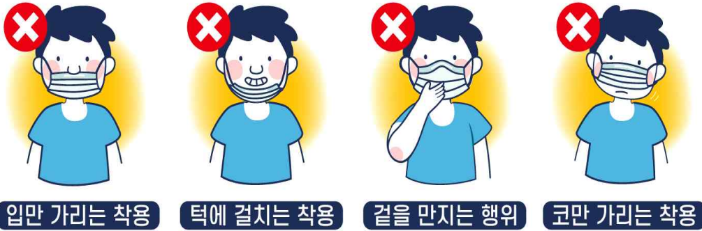
입만 가리는 착용 턱에 걸치는 착용 걸을 만지는 행위 코만 가리는 착용